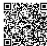
申込フォームはこちらから